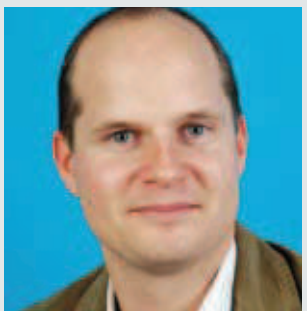
Convention Bureau Oberösterreich Peter Pühringer www.tagung.info