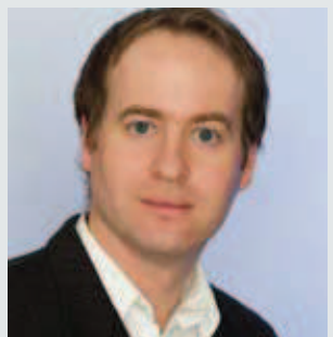
Conventionland Kärnten Max Egger www.convention.karnten.at