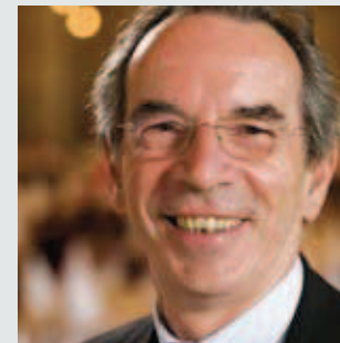
Vienna Convention Bureau Christian Mutschlechner www.vienna.convention.at