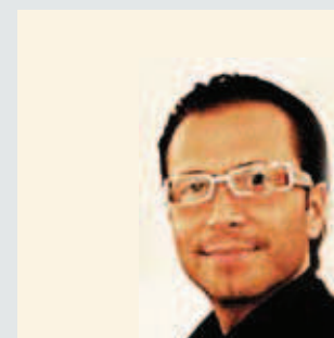
Österreich Werbung – austrian business and convention network Alexander Kery www.abcn.at