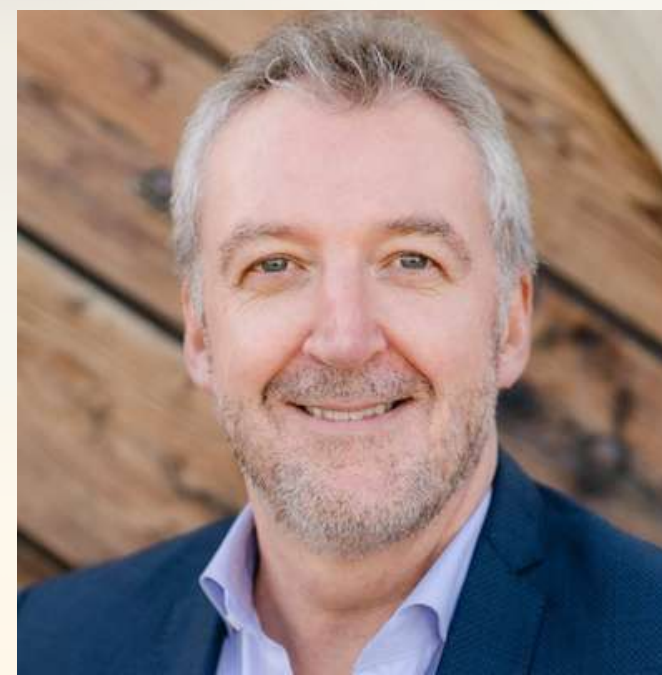
NICOLE KÖRBER KOMMUNIKATION ACB OFFICE