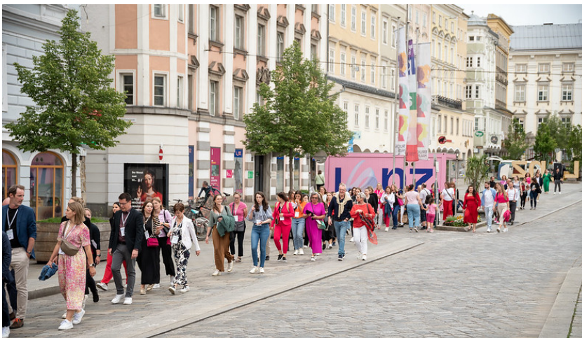
Bilduntertitel: Convention4u Teilnehmende unterwegs durch die Linzer Innenstadt