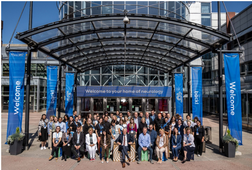
Bilduntertitel: EAN Helsinki 2025